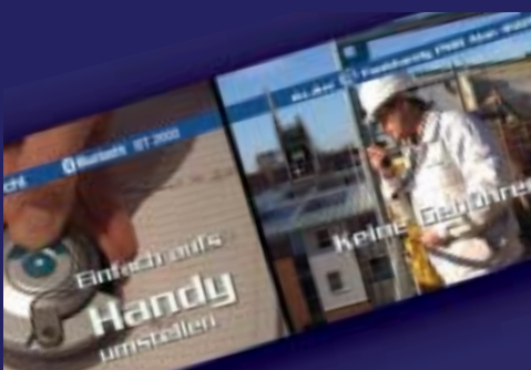
Messe- und Produktfilme für Alan

Nun sind Sie an der Reihe mit letzten Änderungswünschen, die jetzt noch umgesetzt werden können. Erst wenn Sie den Rohschnitt abgesegnet haben, werden Bild und Ton abgemischt, gerendert und zu einer Masterdatei zusammengefügt. Diese Masterdatei dient zu guter Letzt als Vorlage für alle weiteren Kopien Ihres Films auf verschiedene Videoformate, DVD oder CD-Rom.