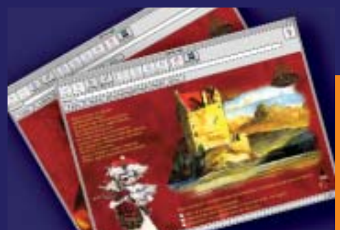
Internet - Gewinnspiel zur Verkaufsförderung für Dimple