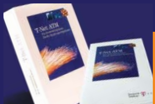
Darstellung ATM-Technologie für Telekom