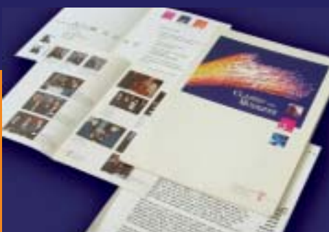
Pressemappe, Film für Telekom

Setzen Sie auf die Macht der Bilder! Sie werden vom Betrachter als erstes wahrgenommen und transportieren nonverbale Botschaften. Bilder sind ein bekanntermaßen erprobtes Mittel zur Darstellung reiner Fakten ebenso wie zur Weckung von Emotionen. Dies gilt für Fotografien genauso wie für Filmsequenzen oder Zeichnungen. Und mit Infographiken bringen wir Inhalte visuell so auf den Punkt, dass sie im Gedächtnis ihrer Betrachter lange haften bleiben.