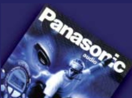
POS, Kataloge für PANASONIC

Ebenso machen wir Ihnen Vorschläge, wie Sie zu gewissen Stichworten aus Ihrer Branche bei Google auf der ersten Seite gelistet werden. Denn Suchmaschinenoptimierung ist heute der Schlüssel zum Erfolg Ihrer Website.