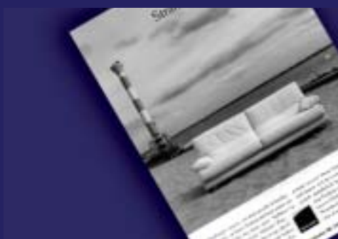
Anzeigenserie für Lignet Rosé