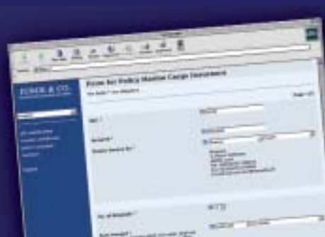
Online Versicherungszertifikate für Junge