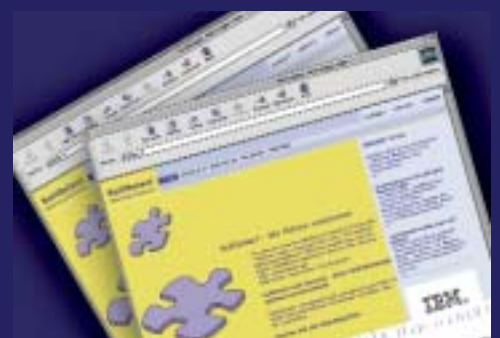
Presstexte für Softselect