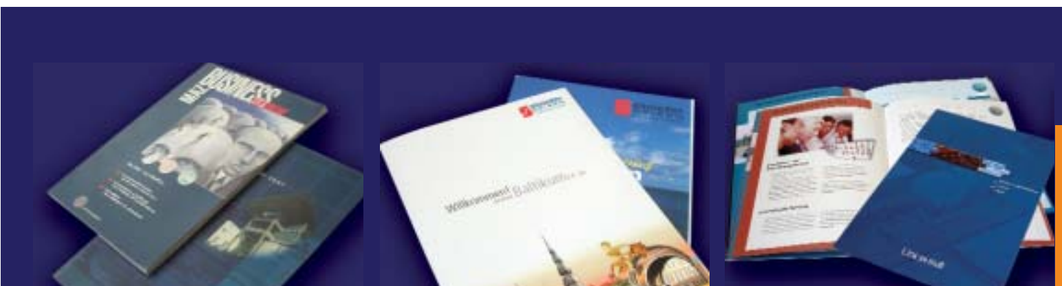
Kundenmagazin, Geschäftsbericht für MAZ

Alle Daten Ihres Verteilers führen wir in einer Datenbank zusammen. Jeder Adresse können wir Merkmale zuweisen. Damit sind wir in der Lage, Redaktionen gesondert nach Themen zu selektieren und anzuschreiben.