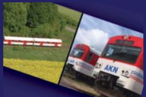
Dokumentation für Sterac