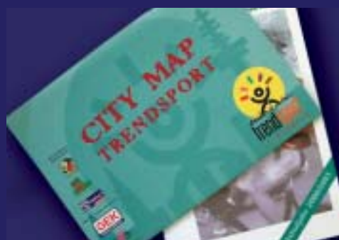
Programme, Öffentlichkeitsarbeit für HSB