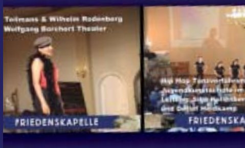
Veranstaltungsdokumentation für Friedenskappe