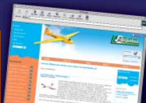
Shopsystem für Staufenhöhl

Denn nur Projekte, denen eine klare Wirtschaftlichkeitsbetrachtung vorangeht, leisten einen nachhaltigen Beitrag der IT zum Unternehmenswert. Aus diesem Grund machen wir Ihnen Vorschläge, wie IT-Projekte die Wertschöpfung in Ihrem Unternehmen erhöhen, die Effizienz steigern, zusätzlichen Kundennutzen schaffen oder die Kundenbindung sicherstellen.