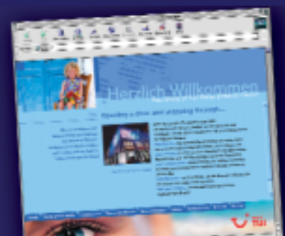
CMS-Lösung mit Reddot für TUI